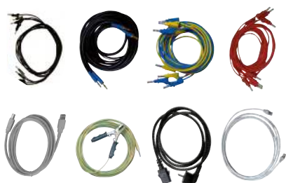
Conjunto estándar de cables de ensayo

Esta opción se puede añadir al conjunto de cables básico para conectar a todos los zócalos de los equipos de ensayo. Incluye también 20 adaptadores para las conexiones del bloque terminal y 3 puentes para poner en paralelo las salidas de corriente.