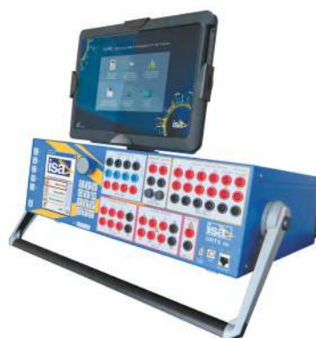
Local Touch Control

Con la opción Local Touch Control el equipo puede ser manejado fácilmente utilizando una pantalla táctil muy robusta y con las aplicaciones del software de control manual. El Local Touch Control se puede utilizar conectado o desconectado del DRTS 66. Cuando se utiliza conectado al equipo de ensayo el resistente Touch Local Control está fijado al equipo mediante un robusto módulo con bisagras. Si está desconectado del equipo de ensayo el módulo Local Touch Control se puede manejar como una robusta tableta de control.