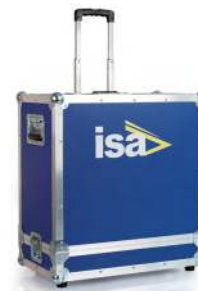
Maleta de transporte robusta