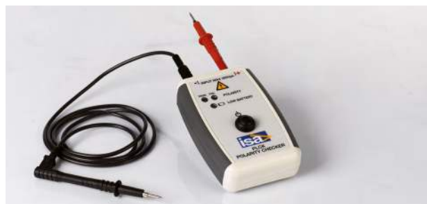
Verificador de polaridad PLCK

PLCK resuelve este problema fácilmente. Cuando se inicia el ensayo, el DRTS 66 genera una forma de onda especial, no sinusoidal, que se inyecta en los cables de conexión. La verificación de polaridad se realiza muy fácilmente conectándolo en el lado del relé. PLCK tiene dos luces: verde y roja. La luz verde se enciende cuando la polaridad es correcta; y la luz roja se enciende cuando la polaridad es incorrecta.