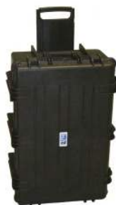
Maleta de transporte robusta en plástico (tipo Discovery)